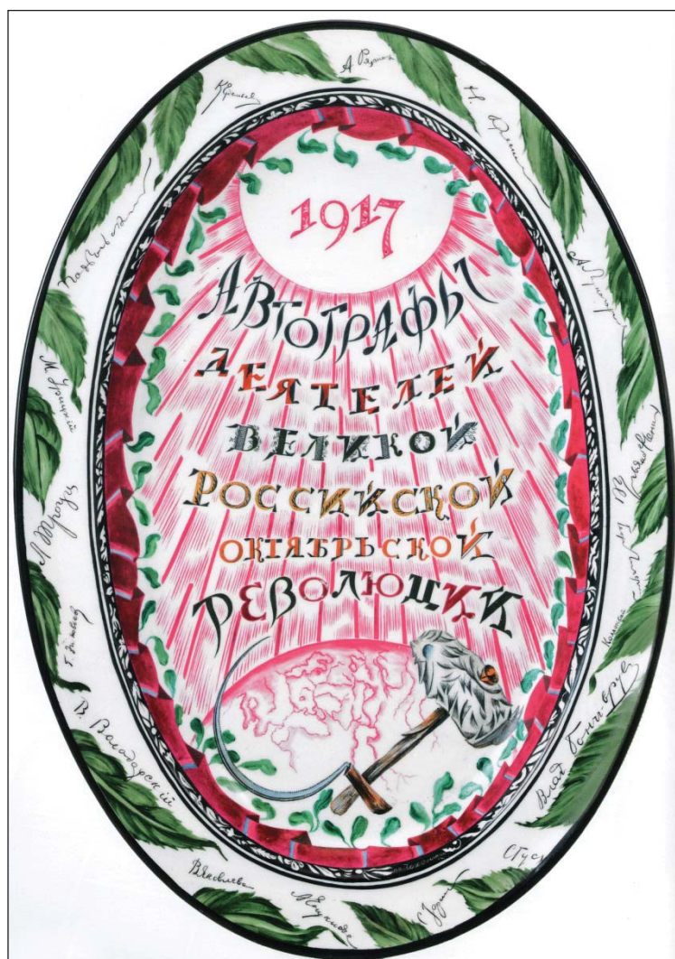
Блюдо «Деятели великой Октябрьской революции 1917 г.», Петроградский фарфоровый завод, по рисунку С. Чехонина, 1921 г. 17 подписей на ободке, по часовой стрелке снизу: А. Енукидзе, В. Яковлева, В. Володарский, Г. Зиновьев, Л. Троцкий, М. Урицкий, Н. Подвойский, К. Еремеев, А. Рязанов, Н. Крестинский, А. Луначарский, В. Ульянов, Г. Чичерин, А. Коллонтай, В. Бонч-Бруевич, С. Гусев, С. Зорин. Сталин и Бухарин отсутствуют.

Каковым было влияние иностранных держав на то, что происходило в России между февралём и октябрём?